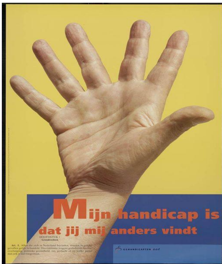
Poster uit de oude doos maar nog steeds actueel! (1996)